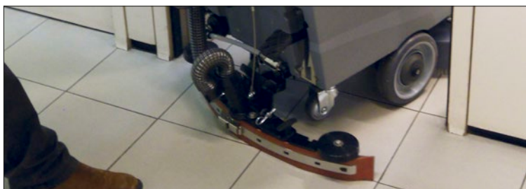
Tergitore regolabile, comodo e compatto