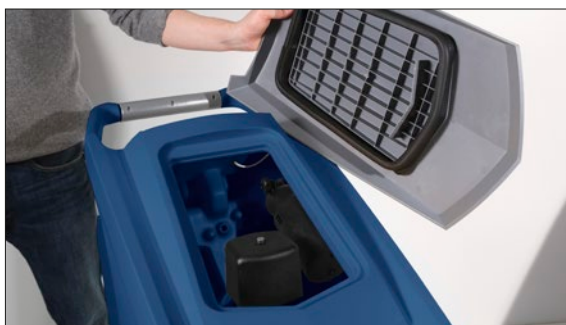
Filtro raccolta grossi detriti + filtro protezione motore aspirazione